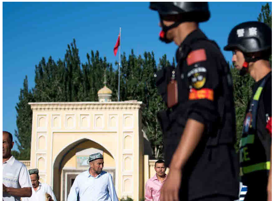
Les Ouïghours : les musulmans chinois.

M.V. : La France comme l'Europe colent aux positions des États-Unis. Ce qui est une grosse erreur car nous ne sommes pas en compétition. On aurait plutôt intérêt à signer des accords com-